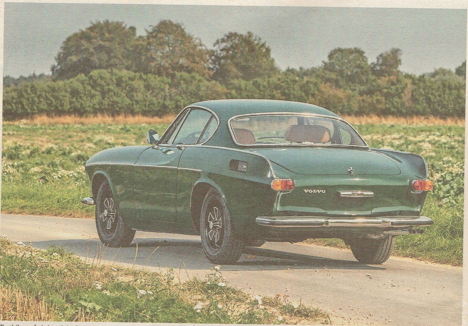
Testbilen står i sin originale Cypress Green-lakering, der kun blev tilbudt i 1972. Den var indtil fornylig til salg for 240.000 kr. hos DK Classic Cars.

Der blev i alt bygget næsten 50.000 stk. af 1800-serien, hvilket går ud over investeringspotentiallet.