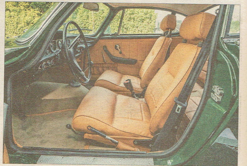
En 1800 E renovering hos DK Classic Cars inkluderer en ompolstret kabine. Der er også et bagsæde, men pladsen rækker kun til et par mindre børn.

1800 E tager sig godt ud den dag i dag med sit filmstjerne-look, og rent økonomisk er den til at komme i nærheden af for mange