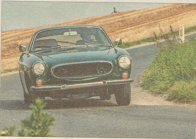
Det er ikke den mest sindsoprivende køremaskine at kaste gennem et sving, men Volvo'en er bygget af robuste dele og kører ganske hæderligt.